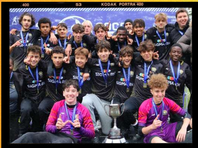
U15 masculin IR, champion Interrégional, Alma 2022